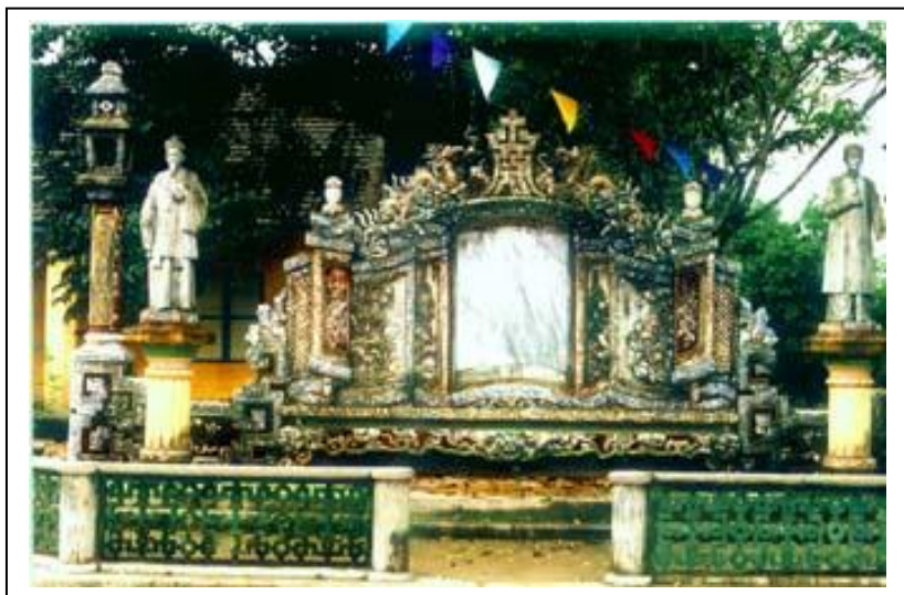
Ảnh 8: Văn Bia kỷ niệm Đệ Nhất Bách Chu Niên (1861-1961)

Thánh Gioan Đoàn Trinh Hoan chịu tử vì Đạo, đặt tại nhà thờ Xuân Long (Huế).