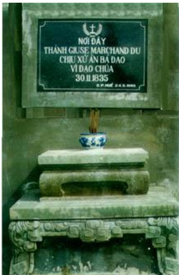
Ảnh 10: Văn bia đánh dấu nơi hành quyết Thánh Marchand Du.