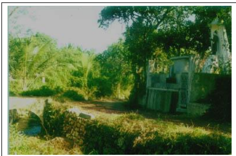
Ảnh 11: Tượng đài, nơi đặt bia đánh dấu vị trí xử trảm Thánh Phaolô Bường.