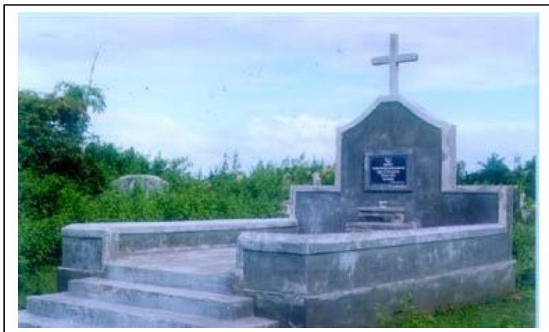
Ảnh 9: Nơi hành quyết Thánh Marchand Du.