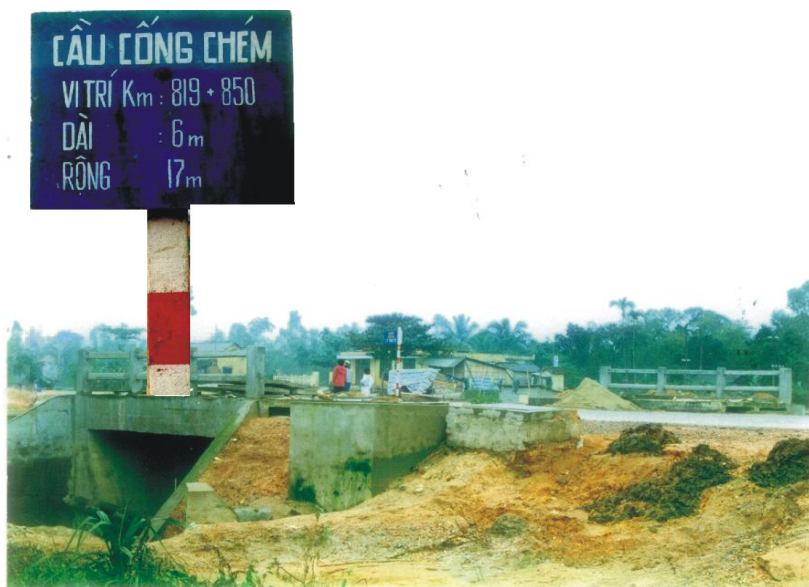
Ảnh 6 : Cống Chém ngày nay (năm 2002).

Đầu ngài bị bêu 3 ngày tại nơi hành quyết (“để làm gương” như bản án đã ghi). Nhưng hôm sau, các tín hữu đã lấy được và mang về họ Nhu Lý cùng với thi thể ngài.