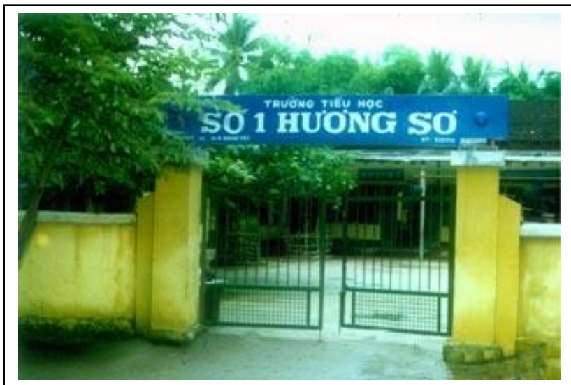
Ảnh 7: Chợ An Hoà cũ, nay là trường Tiểu Học số 1 Hương Sơ, 10/4 Đặng Tất, Huế (năm 2002).